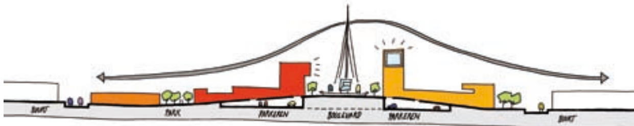
Kanaleiland stijgt mee met de brug