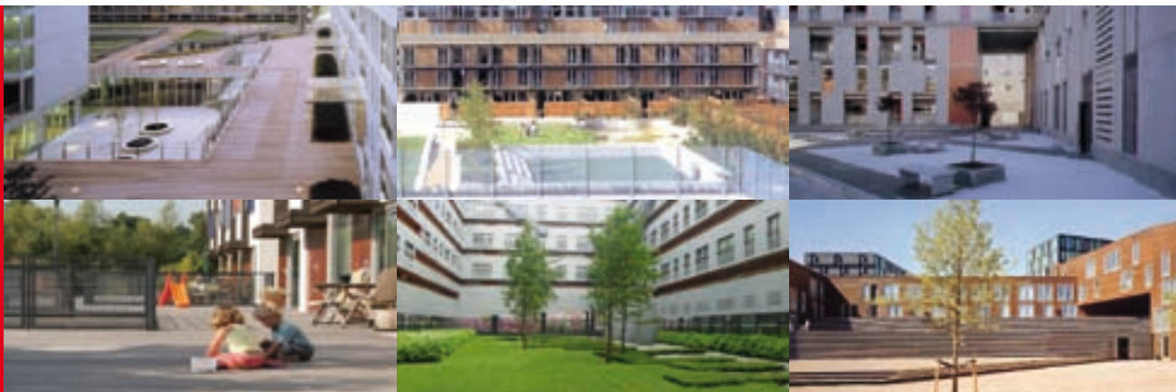
Dit zijn sfeerplaatjes

waar u graag naar zou willen verhuizen. Met deze gegevens kan de corporatie haar huurders beter begeleiden naar een andere woning.